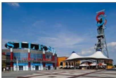
Das Silesia City Center in Kattowitz ist mit einer Verkaufsfläche von rund 85.000 Quadratmetern das größte Shopping Center in Schlesien.