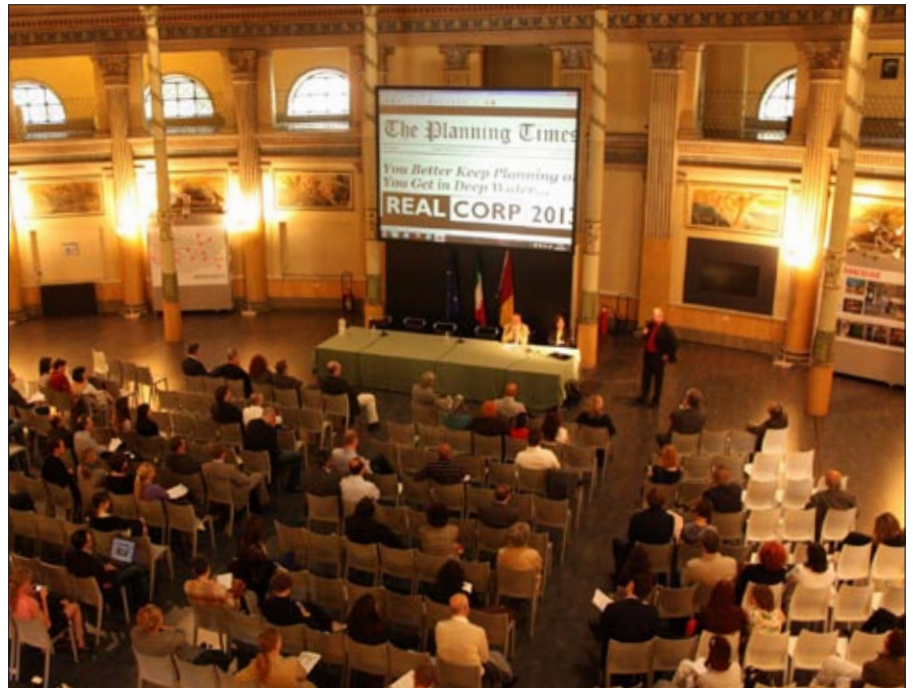
Ungewöhnliches Ambiente: die einstige Ausstellungshalle eines Aquariums