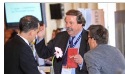
Nicht nur die zahlreichen Podiumsdiskussionen boten reichlich Gesprächsstoff.