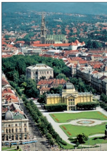
Etwa ein Fünftel aller Einwohner Kroatiens lebt in der Hauptstadt Zagreb.

Aufschwung. Schon bei den Ländern, die 2007 in die EU aufgenommen wurden, fiel der positive Effekt teilweise deutlich geringer aus. Kroatiens Beitritt fällt zudem in eine Zeit, in der die Volkswirtschaften in