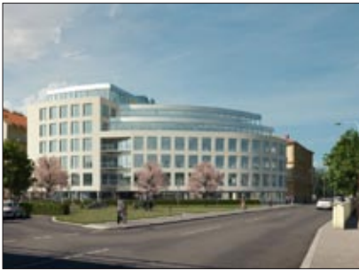
Rund 7.000 Quadratmeter Bürofläche umfasst das Riverview in Prag, das Skanska nahe dem Geschäftszentrum Andel errichtet.