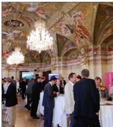
Bewusst schuf die GREET Vienna viel Raum für individuelles Networking.