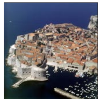
Kroatiens Adriaküste war auch schon vor dem EU-Beitritt des Landes eine der schönsten und beliebtesten Touristendestinationen.

Seit 1. Juli 2013 ist Kroatien Mitglied der EU. Es ist nach Slowenien der zweite Staat, der nach dem Zerfall Jugoslawiens den Sprung in die Europäische Gemeinschaft geschafft hat. Doch irgendwie klingt der Jubel darüber eher gedämpft.