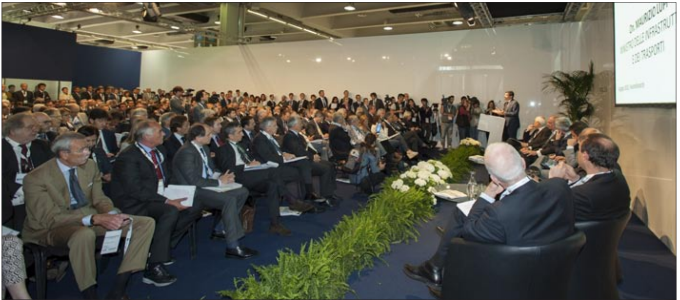
Voller Saal bei der Eröffnung des EIRE-Konferenzprogramms mit Maurizio Lupi, Minister für Infrastruktur und Transport

Die Lage des Immobilienmarkts in Italien ist alles andere als rosig. Dennoch war die EIRE Expo Italia Real Estate Anfang Juni in Mailand keine „Jammerversammlung“, vielmehr vermittelte sie den Eindruck einer allgemeinen Aufbruchstimmung.